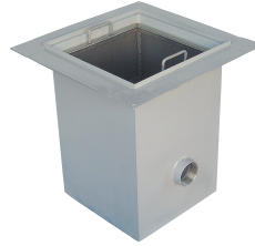
■標準スラブ開口寸法